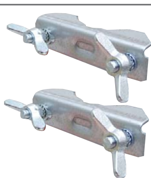
Doppio morsetto ad altaresistenza con galletto + bullone in pressofusione