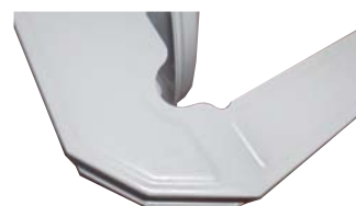
Supporto premontato, verniciato in tinta con il disco e dotato di passacavi.