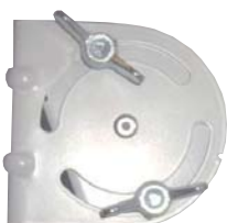
Viti di bloccaggio elevazione con galletto + bullone in pressofusione